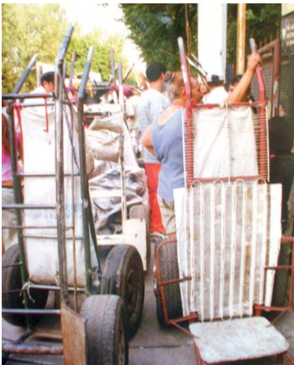
Carrinhos utilizados pelos catadores em Buenos Aires

Sem dúvida, uma possível solução não pode vir isolada de uma série de reformulações de outro tipo de políticas como as educativas, as de moradia, as de saúde, entre outras. Talvez pareça ambicioso em termos de saídas possíveis, mas sinceramente não creio que se possa continuar pensando em soluções se o Estado continua fazendo distinção entre “políticas para os pobres” e “políticas produtivas”.